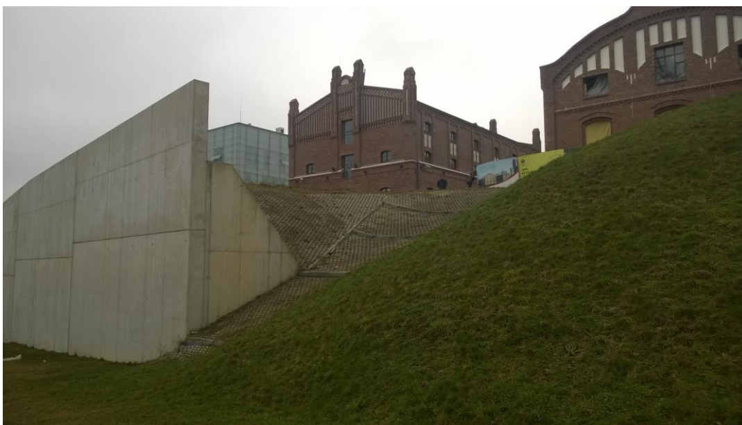
Rys. 2 Miejsce projektowanego muru oporowego