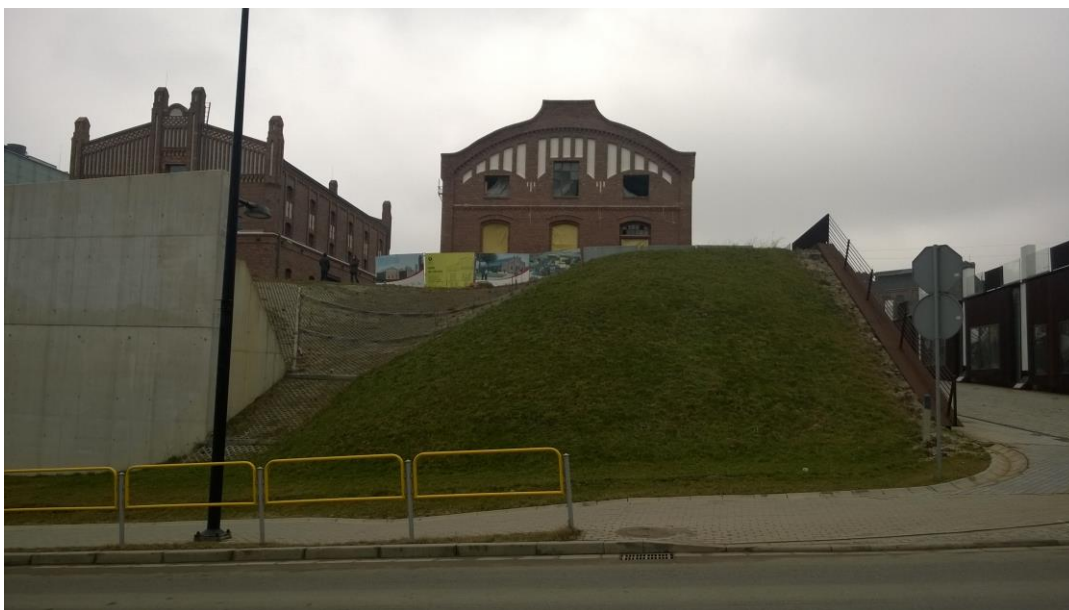
Rys. 1 Miejsce projektowanego muru oporowego

Przedmiotem niniejszego opracowania jest żelbetowy mur oporowy zabezpieczający skarpę wzdłuż ul. Dobrowolskiego na terenie Nowego Muzeum Śląskiego. Projektowany mur stanowił będzie kontynuację istniejącego muru wykonanego w trakcie budowy nowego gmachu Muzeum Śląskiego.